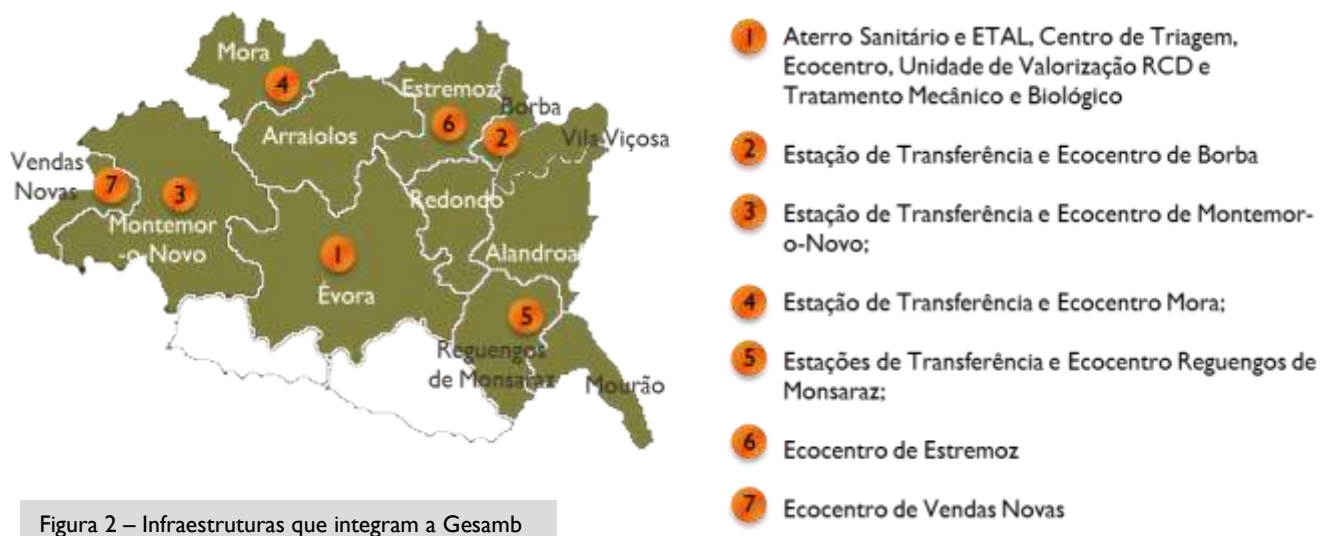
Figura 2 – Infraestruturas que integram a Gesamb